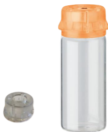
Adapterring för små flaskhalsar