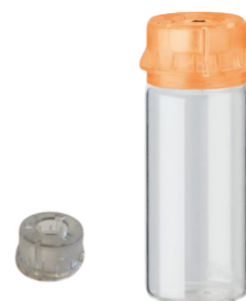
Adapterring för små flaskhalsar