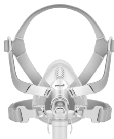
YF-02 - Ventilerad ansiktsmask utan pannstöd