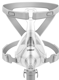
YF-01 - Ventilerad ansiktsmask med pannstöd