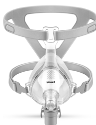
YF-03 - Ventilerad klassisk ansiktsmask med pannstöd