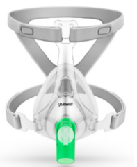
YF-RT03 - Oventilerad ansiktsmask utan AAV med portar för endoskopi