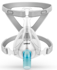
YF-RT02 - Oventilerad ansiktsmask utan AAV