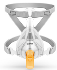
YF-RT01 - Oventilerad ansiktsmask med AAV

Material: Silikon, PC, PP och nylon Förpackningsstorlek: 10 st / förp Användningstid: 90 dagar